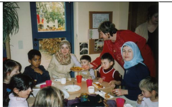
Solidarität, Hilfe für Menschen in Not als Weg zum Glück; gemeinsames Feiern religiöser Feste als Weg zum Glück