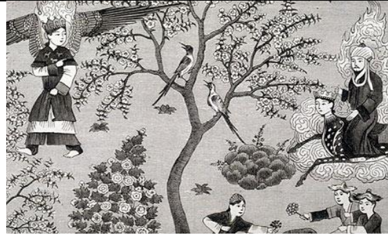
Vorstellungen von einem „Paradies“ oder Himmel („jenseitige Glücksorte“)