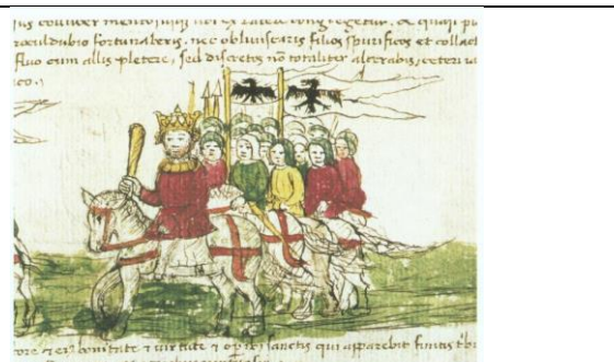
Gewalt / Krieg angeblich im Namen Gottes / unter Berufung auf Glauben und Religion (Dschihad, Kreuzzüge, ...) als vermeintlich sicherer Weg ins Paradies