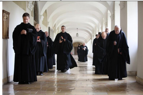
Askese, Verzicht, Hinwendung zu Gott; ein Leben im Dienst des Glaubens / im Gebet als religiöser Weg zum Glück